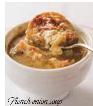
French onion soup