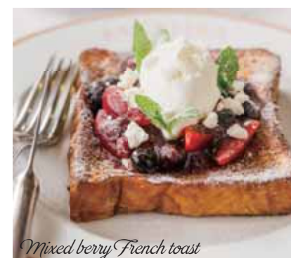
Mixed berry French toast

マロン クレームキャラメル 1,000 マロンクリーム、マスカルポーネチーズ、マロンシロップ漬け、塩バターキャラメルソース Chestnut crème caramel • chestnut cream, Mascarpone, chestnuts in syrup, salted butter caramel sauce