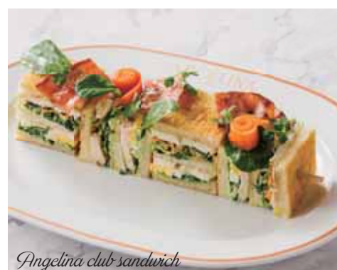
Angelina club sandwich