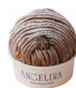
デミサイズ DEMI (Half-size)